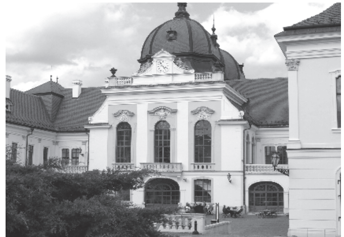
2008-as kirándulásunk fotója Gödöllő