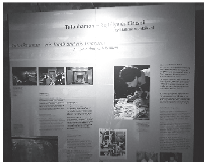
A fotó a Tutenhamon kiállításon készült