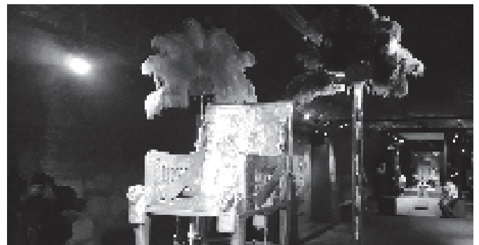
a fotót Kákonyi Gabriellai készítette a Tutanhamon kiállításon