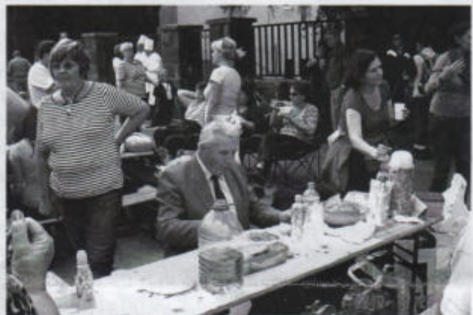
Főnök úr megkóstolja