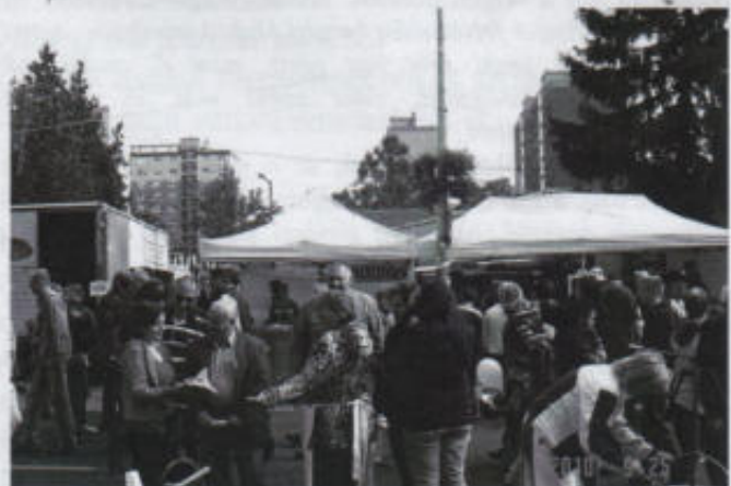
Lecsókóstolás és tagtoborzás

Kiadja: az ARÉV Baráti Kör Egyesület Székesfehérvár, Jancsár u. 11. Adószáma: 18495717-1-07 Felelős szerkesztő: Galambos Ottó Készült: 550 példányban A sokszorosítás az APOLLÓ Nyomdában készült Kapják: Az egyesület tagjai, nyugdíjasok, támogatók, szponzorok