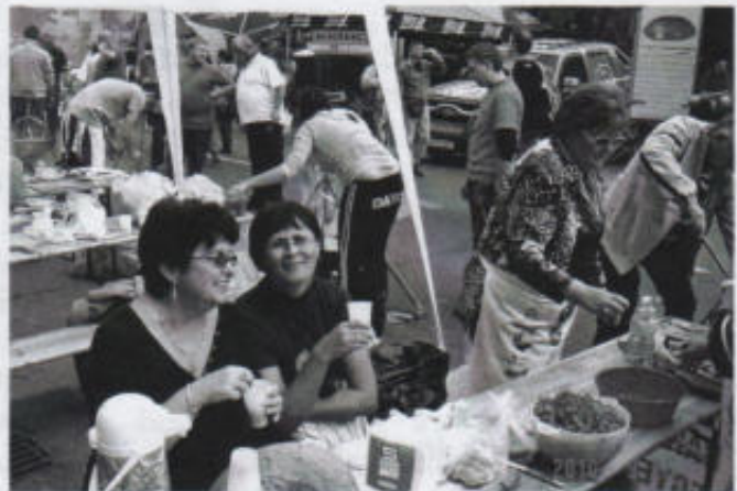
Nos már eldőlt