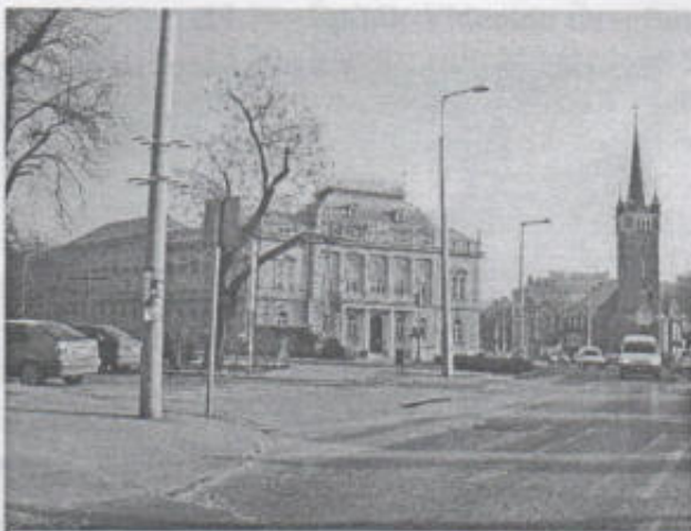
Megyei Bíróság épülete

Visszatérve az előadás címéhez, saját szakmánk az építőipar sem maradt ki a gazdasági folyamatból. A 90-es évek elején érzékelhető volt a beruházások rohamos visszaesése. Építőipari cégek „mélyrepülése”, esetleg megszűnése ugyanúgy jellemző volt abban az időszakban, mint bármely más iparágban.